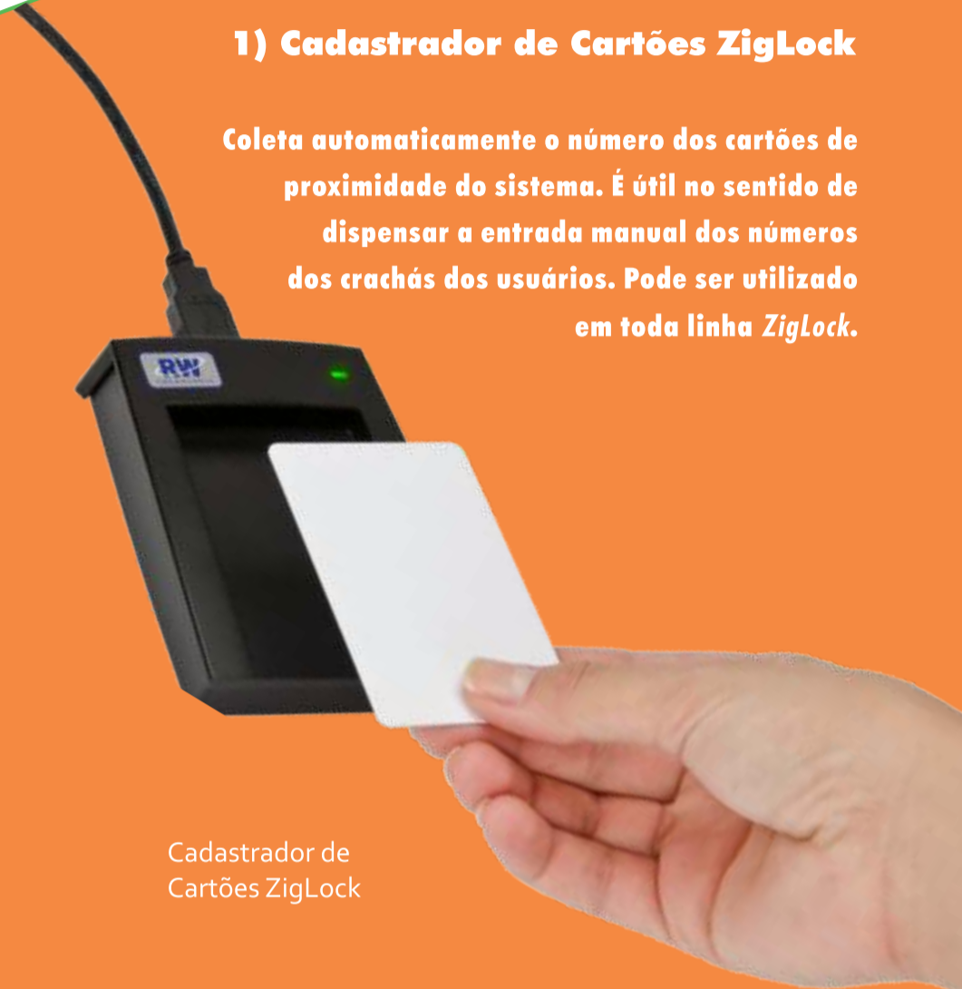
Cadastrador de Cartões ZigLock

Coleta automaticamente o número dos cartões de proximidade do sistema. É útil no sentido de dispensar a entrada manual dos números dos crachás dos usuários. Pode ser utilizado em toda linha ZigLock.