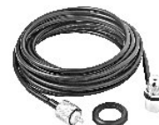
M-801k Kit Curto Rg-58 - 3,5 m Cabo M-802k Kit Médio Rg-58 - 5,5 m Cabo M-803k Kit Longo Rg-58 - 7,5 m Cabo