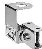
M-550 Suporte Calha Cromado