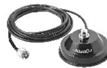
M-700K Suporte Magnético 4,0 m Cabo