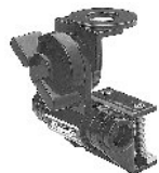
M-500 Suporte Calha Zamak